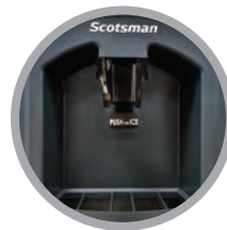
Kit opcional de dispensado con palanca higiénica disponible (KHDSANLV)