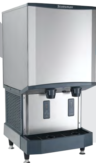
HID540A-1 con patas KLP24A opcionales

Los cojinetes sellados y sin mantenimiento garantizan la máxima confiabilidad y contribuyen a una larga vida útil de la máquina