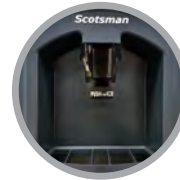
Kit de Distribution à Levier Hygiénique en Option Disponible (KHDSANLV)