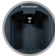
Goulotte Standard Facile à Pousser