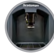
Kit Opcional de Dispensado con Palanca Higiénica Disponible (KHDSANLV)

HD30 - Dispensador de Hotel 76.2 cm (30")