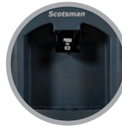
Deslizadera de Empuje Fácil Estándar