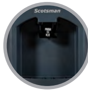
Goulotte Facile à Pousser