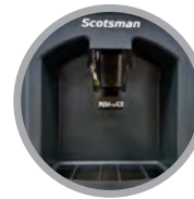
Kit de Distribution à Levier Hygiénique en Option Disponible (KHDSANLV)