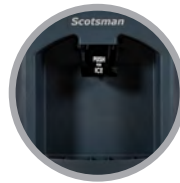
Deslizadera de Empuje Fácil