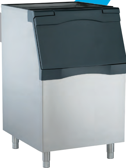
B530S se muestra con patas KLP8S opcionales.